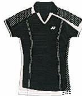
ブラック (007) (パウダーピンク、ブラック)