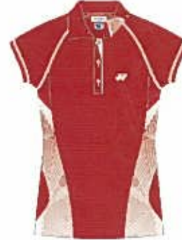
クリスタルレッド (688) (クリスタルレッド、ホワイト)