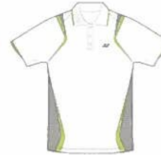
ホワイト (011) (ホワイト)