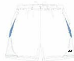
オーシャンブルー (489) ホワイト/ブラック (141)