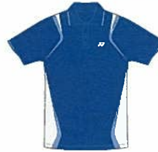
ディーブルー (566) (ホワイト)