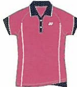
ルージュピンク(124) (ネイビーブルー)