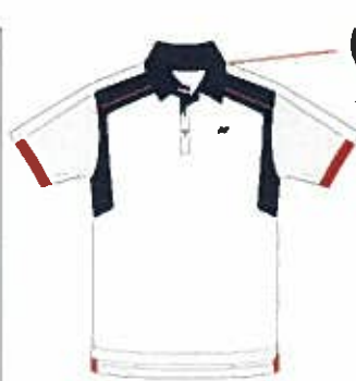
クリスタルレッド (688) (ネイビーブルー)

品番: 10064 (Uni ポロシャツ) 価格: ¥7,245 (本体価格 ¥6,900) 日本製 カラー: クリスタルレッド (688)、オーシャンブルー (489) ブラック (007) サイズ: SS/S/M/L/O/XO 素材: 【身頃】ベリークールドットメッシュ / ポリエステル 100% 【切替部】エアホールメッシュ / ポリエステル 100% 発売日: 2010年6月中旬 * 台襟とは: シャツなど襟下にある帯状の部分