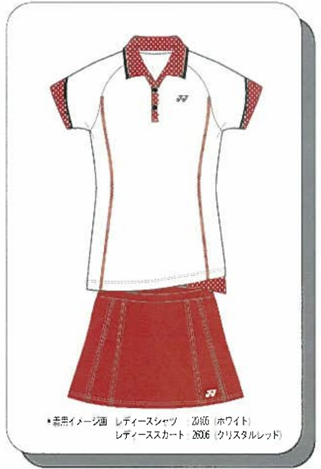
※着用イメージ画 レディースシャツ 2016 (ホワイト) レディーススカート 2006 (クリスタルレッド)

品番：26006 (Ladies スカート インナーズハッツ付) 価格：¥6,300 (本体価格 ¥6,000) 日本製 カラー：ホワイト (011)、ブラック (007)、ネイビーブルー (019) ミドルグレー (247)、パウダーピンク (421)、クリスタルレッド (688) サイズ：SS/S/M/L/O/XO 素材：【身頃】ソフトモックニット / ポリエステル 100% 【インナーズハッツ】ベリークールストレッチスムース / ポリエステル 90%・ポリウレタン 10% 発売日：2010年6月中旬 ＊両脇ポケット付