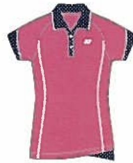
ルージュピンク(124) (ネイビーブルー)