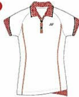
ホワイト(011) (クリスタルレッド、ブラック)