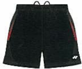
クリスタルレッド (688)