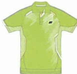
ライムグリーン (008) (ホワイト)

品番: 12039 (Uni ポロシャツ) 価格: ¥7,875 (本体価格 ¥7,500) 日本製 カラー: ライムグリーン (008)、クリスタルレッド (688) ホワイト (011) サイズ: SS/S/M/L/O/XO 素材: 【身頃】ストロングニット / ポリエステル 100% 【切替】ストレッチマイクロメッシュ / ポリエステル 100% エアホールメッシュ / ポリエステル 100% 発売日: 2010年6月中旬