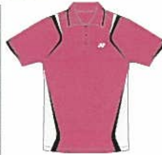
ルージュピンク (124) (ブラック)

品番: 10063 (Uni ポロシャツ) 価格: ¥7,245 (本体価格 ¥6,900) 日本製 カラー: ルージュピンク (124)、ディーブルー (566) ホワイト (011) サイズ: SS/S/M/L/O/XO 素材: 【身頃】ストレッチマイクロメッシュ / ポリエステル 100% 【切替部】エアホールメッシュ / ポリエステル 100% 発売日: 2010年6月中旬