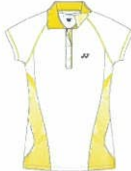
ホワイト (011) (ブラック)