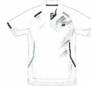
ホワイト (011) (ホワイト、ブラック)