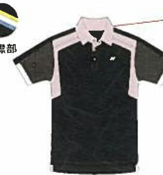
ブラック (007) (ブラック、ホワイト)