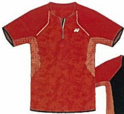
クリスタルレッド (688)