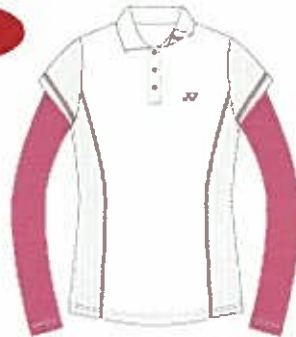
ホワイト(011) (ブラック)