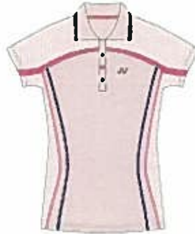
パウダーピンク (421) (ネイビーブルー)