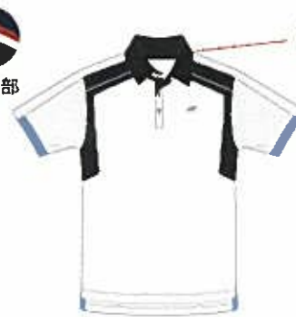
オーシャンブルー (489) (ブラック)