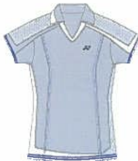
サックス (027) (ホワイト)