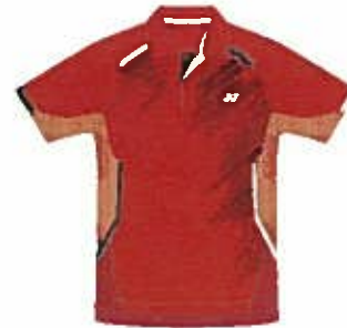
クリスタルレッド (688) (ブラック)