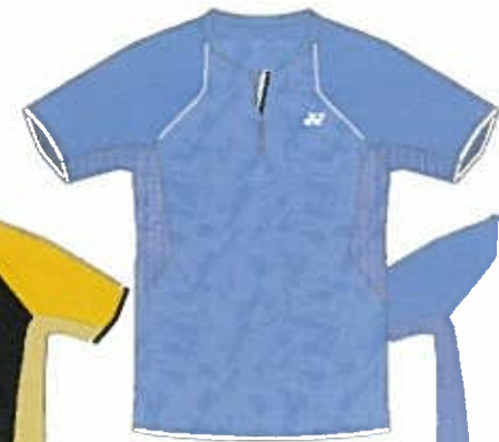
オーシャンブルー (489)