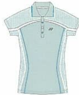
アクアミント (427) (ホワイト)