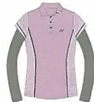
ライラック(215) (ミドルグレー)