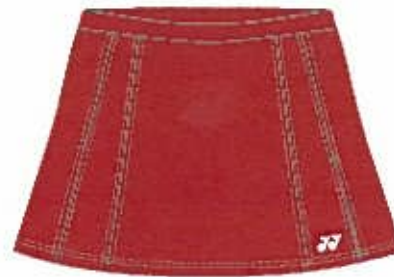
クリスタルレッド(688)