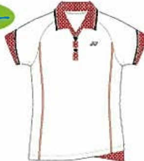
ホワイト(011) (クリスタルレッド、ブラック)