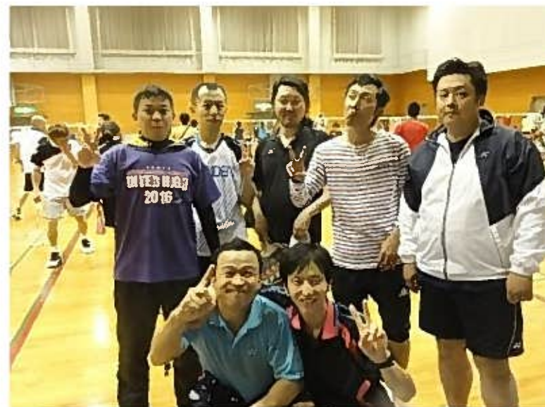
ケンちゃん とゆかいな仲間達