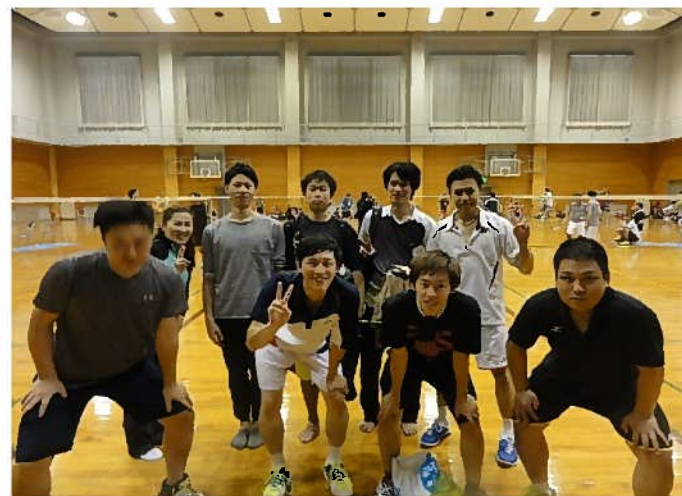
府中ドラゴンズ 玄武