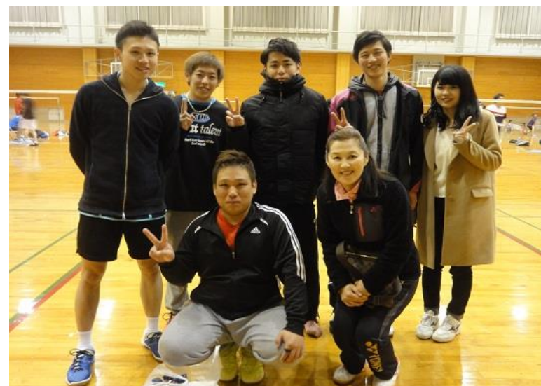
府中ドラゴンズ玄武