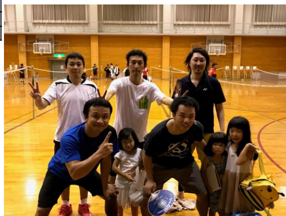
優勝 ケンちゃんとうかかいな仲間たち